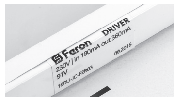
Расположение драйвера вне зоны видимости